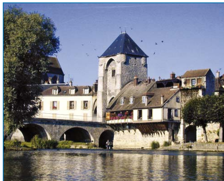
Moret-sur-Loing: den Zugang bewacht das Burgundertor aus dem 12. Jh.